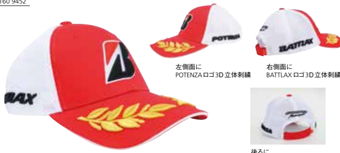
左側面に POTENZA ロゴ 3D 立体刺繍