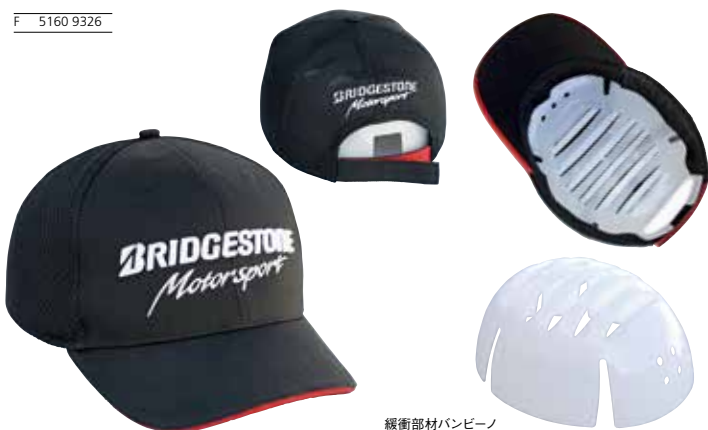
緩衝部材バンピーノ

Material : ポリエステル 80%、綿 20% メッシュ部 ポリエステル 100% 緩衝部材バンピーノ = ポリエチレン樹脂 重量 85g