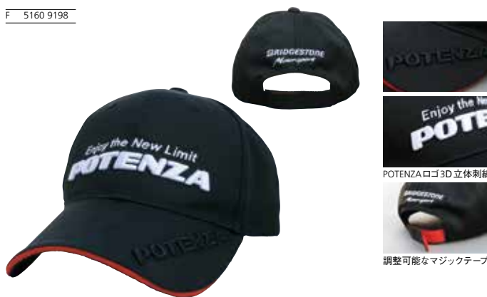
POTENZA ロゴ 3D 立体刺繍