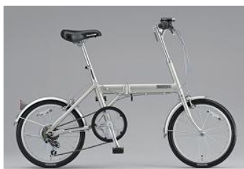
(1) ブリヂストンサイクル 折りたたみ自転車 スニーカーライト 「SNL」

WEB投票頂いた皆様への上記当選発表は、賞品の発送をもってかえさせていただきます。