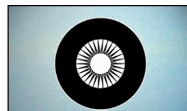
(3) tire tired タイヤタイヤード