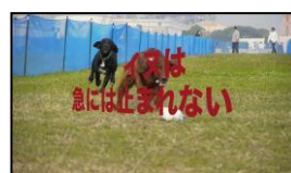
(6) クルマは急に止まれます