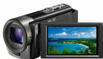
(2) ソニー デジタル HD ビデオカメラレコーダー “ハンディカム” 「HDR-CX180」