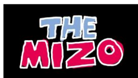
(4) THE MIZO