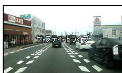
(1) セーフティドライブ

また、投票頂いた皆様の中から抽選で、折りたたみ自転車やデジタルHDビデオカメラレコーダーをプレゼント致します。次の通り力作揃いなので、皆様の投票をお待ちしています。