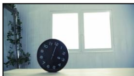
(9) 僕らの向かう世界