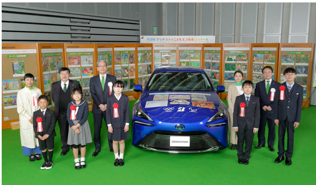
表彰式後の写真撮影

今回のテーマは「しぜんがいっぱい しあわせな 暮らし」で、子どもたちが日常や旅先で触れ合った自然を題材にした、自由で個性あふれる作品を募集しました。全国各地から 53,963 点の応募を頂き、その中から公正かつ厳正な審査の結果、ブリヂストン大賞 5 点をはじめとする 100 点の入賞作品を選出し、4 月 4 日に表彰式を行いました。表彰式では、応募作品をデザインした燃料電池自動車「MIRAI」も公開しました。