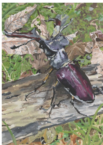
「つかまえたミヤマクワガタ」