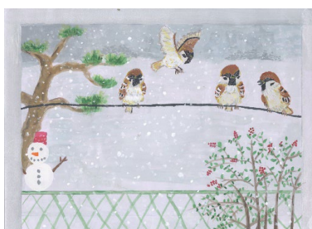
「まどから見えたなかよしすずめ」