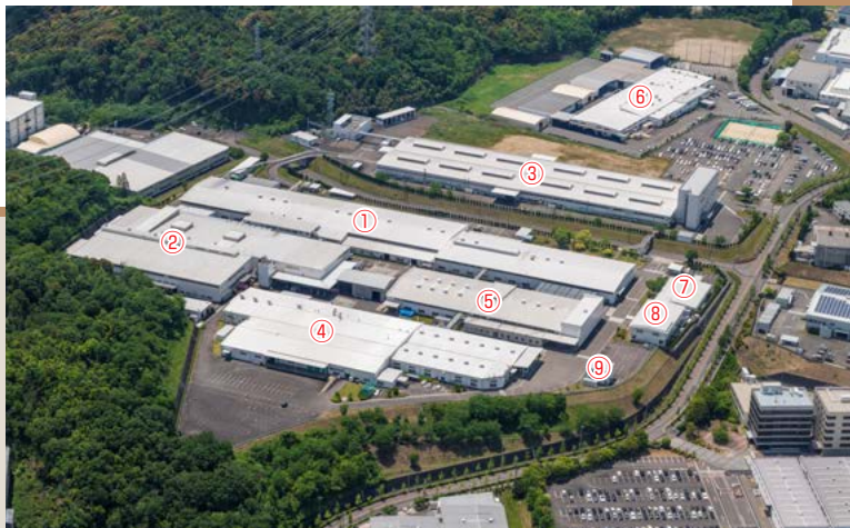
①第1工場 ②第2工場 ③第3工場 ④ブリヂストンスポーツ(株)工場 ⑤ブリヂストン/ブリヂストンスポーツ(株)工場 ⑥ブリヂストンBRM(株)工場 ⑦事務所 ⑧厚生会館 ⑨(株)ブリヂストンEMK事務所