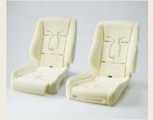
自動車用シートパッド