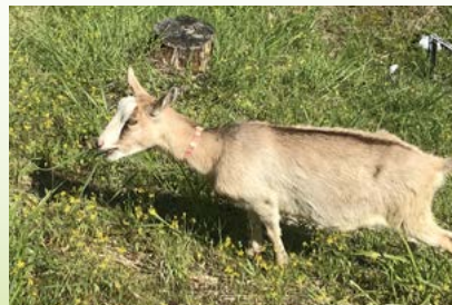
ヤギ放牧による除草

環境に優しい除草活動として、工場敷地周辺緑地において「ヤギ放牧による除草」を実施しています。焼却されていた雑草をヤギに食べてもらう事でCO 2 排出量削減にも貢献しています。