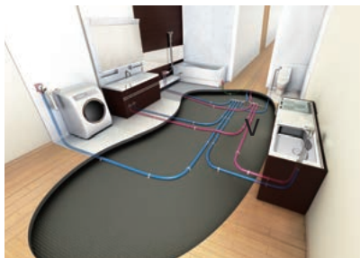
樹脂配管システム