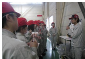
看護学生の学外実習受け入れ

2013年には関市内に「エコピアの森 関」を開所し、定期的に従業員による森林整備活動を実施しています。また、2015年からは、工場近隣で行われる地域スポーツイベントの安全・安心な運営に貢献するため、マラソン大会やサイクルツーリングで救護や給水活動を行い、地域に必要なとされる工場を目指し活動しています。