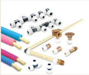
樹脂配管システム