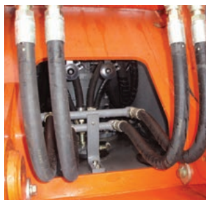
建設機械に使用される高圧ホース

併せて、戸建・集合住宅等の給水・給湯配管システムに使用される樹脂配管を生産しています。これらの製品は樹脂製のため、錆や腐食がないことや、軽量で柔軟性に優れ、振動にも強いことが特長です。また、施工性にも優れており、配管作業の省力化・効率化にも貢献しています。