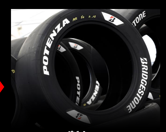
断トツ モータースポーツタイヤ 「 速さ」・「信頼」