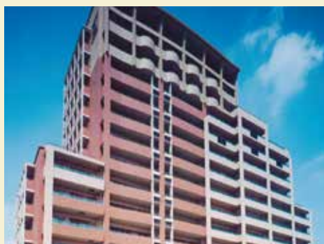
初の免震マンション「レゾンシティ南岡崎」

になりました。条件が整った物件はすべて免震構造にするという方針で建築を進め、以来12年間で18棟の免震マンションを手掛けました。これは、愛知県の不動産会社ではNo.1 *1 の実績です。平成31年に完成を目指す「リコットタワー新安城」の物件も、免震構造のタワーマンション(20階建)です。