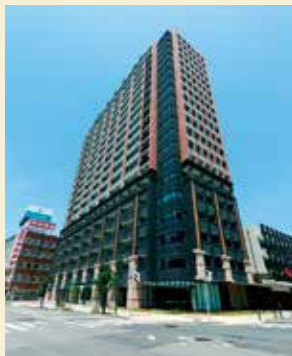
免震マンションの「岡崎ウイズスクエア」

私自身も愛知県の「防災まちづくり」のアドバイザー資格を取得しており、震災時の免震建物の有効性を訴えることもあります。免震マンションは、大地震が起こってもほぼ無傷の状態が残るため、被災を免れた居住者の方が周辺の住民を助ける大きな力になるのではない